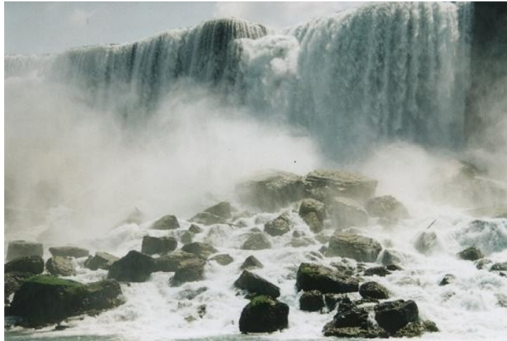
CASCADE DEL NIAGARA