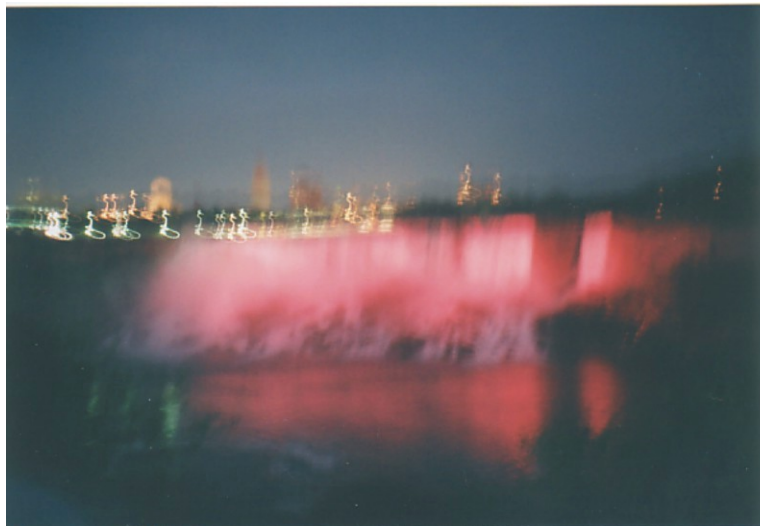
Cascade del Niagara – Foto-miracolo del 2002 scattata da Sahaja Yogi rumeni