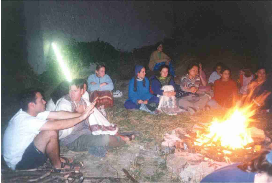
Campo di Daglio: sopra ad un paesino di 300 abitanti vicino a Cabella Ligure - 2001

Un gruppo di Sahaja Yogis sta cantando dei Bhajans intorno al fuoco